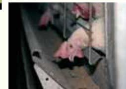
Klassische Legebatterie: tierquälerische Enge